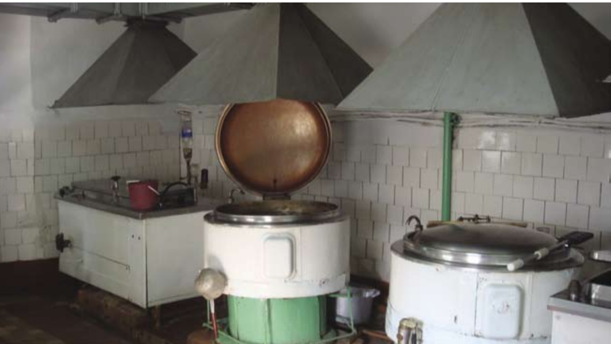
Cantina, Instituția penitenciară nr.11, mun. Bălți Столовая, Пенитенциарное учреждение № 11, мун. Бэлць