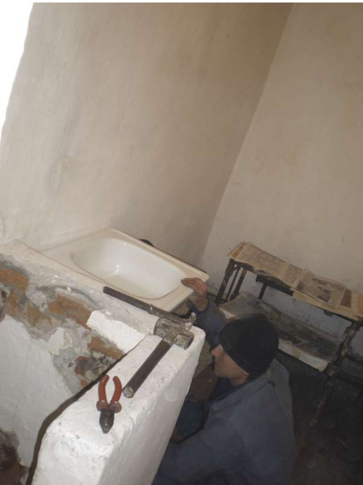
Instalarea lavoarului, Instituția penitenciară nr.5, or. Cahul Установка умывальника, Пенитенциарное учреждение № 5, г. Кахул