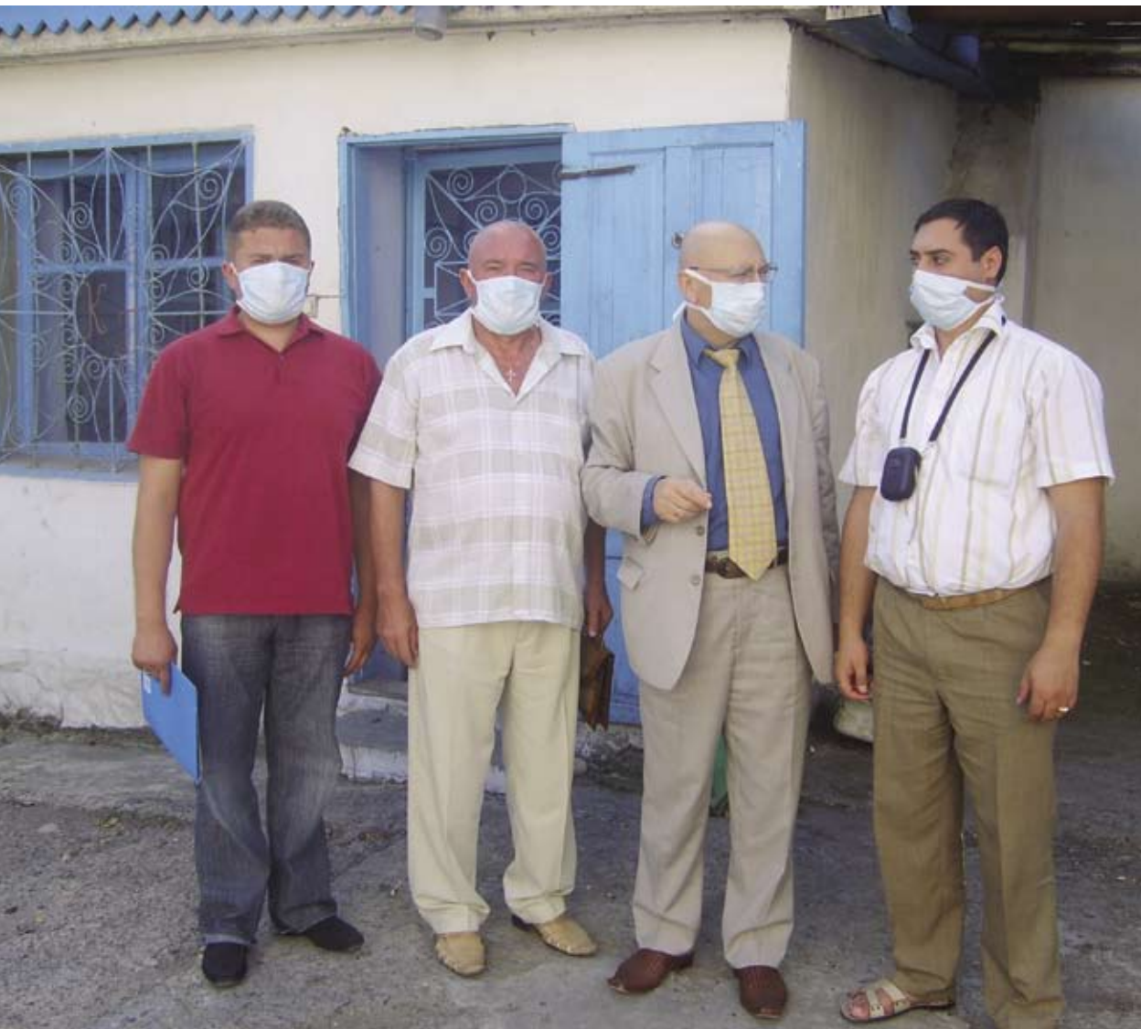
Avocatul parlamentar și membrii Consiliului consultativ în vizită la Spitalul de ftiziatrie nr.2, or. Rezina Парламентский адвокат и члены Консультативного совета в ходе посещения Фтизиатрической больницы № 2, г. Резина