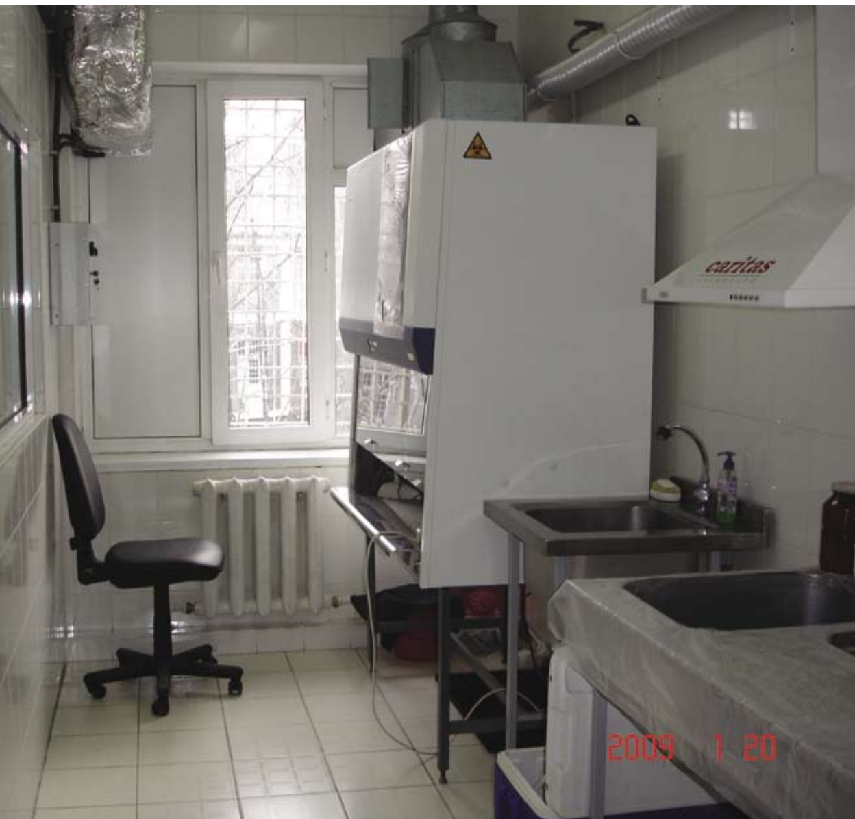
Cabinet medical, Instituția penitenciară nr.16, mun. Chișinău Медицинский кабинет, Пенитенциарное учреждение № 16, мун. Кишинев