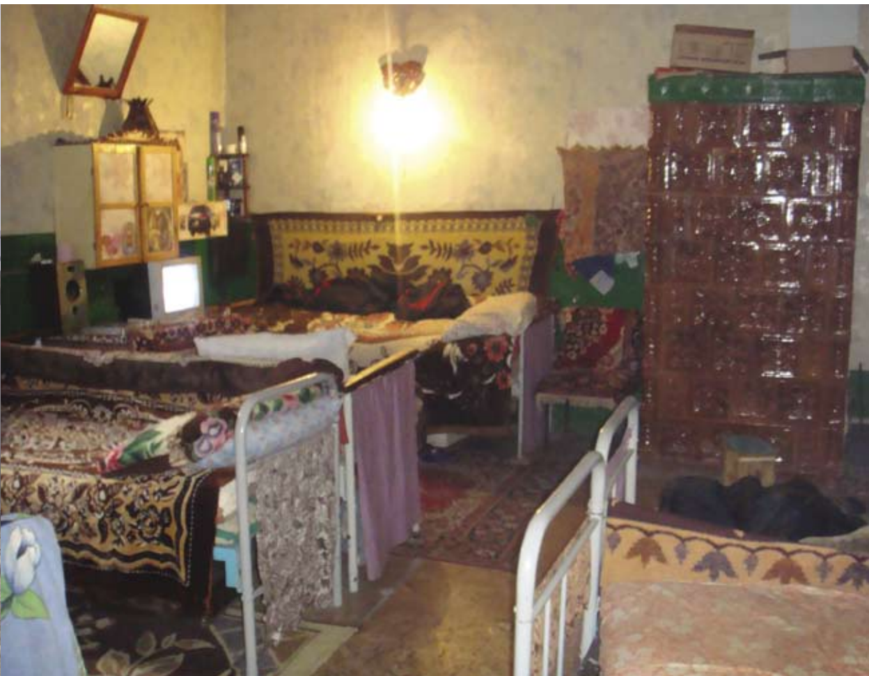
Dormitor, Instituția penitenciară nr.18, s. Brănești, r-nul Orhei