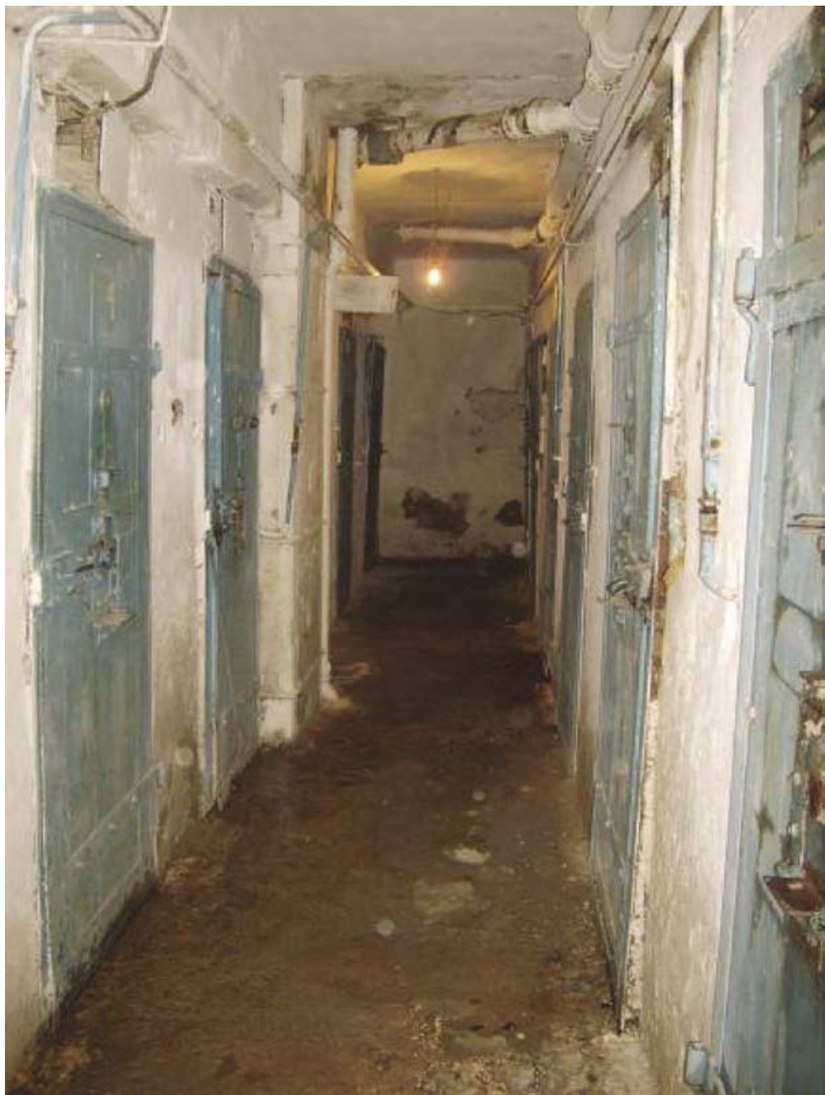
Coridorul celulelor izolatorului disciplinar, Instituția penitenciară nr.17, or. Rezina Коридор камер дисциплинарного изолятора, Пенитенциарное учреждение № 17, г. Резина