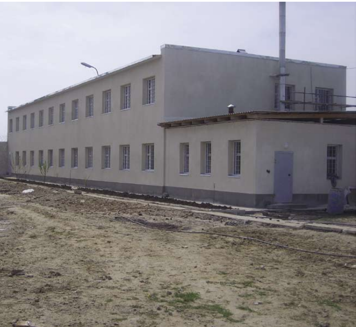
Bloc în construcție, Instituția penitenciară nr.1, or. Taraclia Режимный блок в процессе строительства, Пенитенциарное учреждение № 1, г. Тараклия