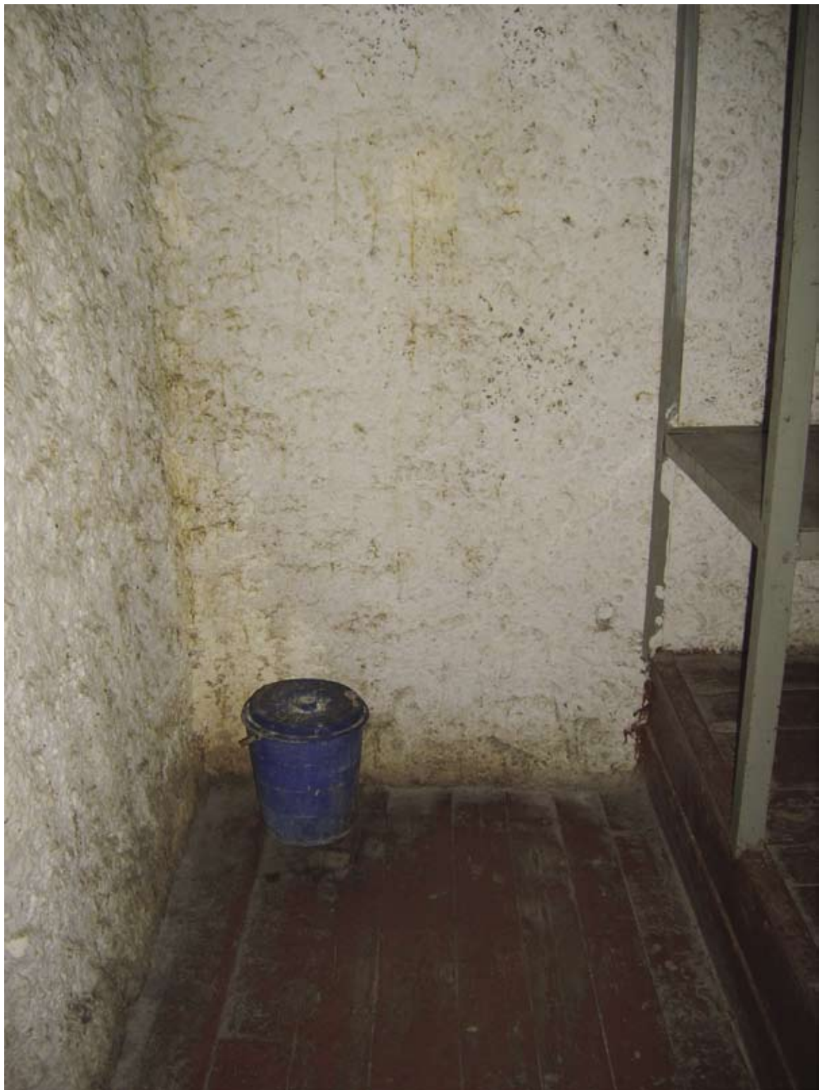
Celula Izolatorului de detenție provizorie a CPR Cahul Камера Изолятора временного содержания РКП Кахул